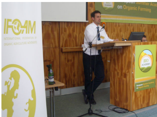
Εικόνα: Ο συντονιστής της IFOAM EU Marco Schlüter στη Bioacademy, στο Λέντιντσε της Τσεχίας

Οι εκπρόσωποι συζήτησαν με την επιτροπή των εισηγητών τις πολυάριθμες αντιδράσεις και ανησυχίες τους σχετικά με την πρόταση της αναθεώρησης. Όλα αυτά εξέφρασαν το δυναμικό συναίσθημα όλων των εμπλεκόμενων φορέων αυτού του σημαντικού αγροτικού τομέα.