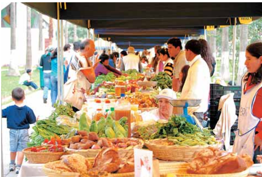
Las ferias "ecológicas" están creciendo en todo el Perú. El gran mercado de estos productos, sin embargo, sigue estando fuera, y nuestro país ya es uno de los mayores exportadores de alimentos orgánicos del mundo.